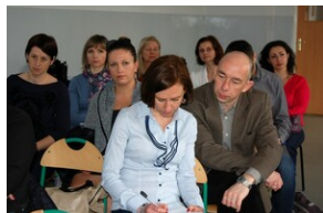
XVII Forum Języka Angielskiego #16