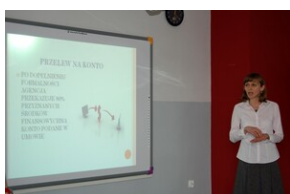
XVII Forum Języka Angielskiego #23