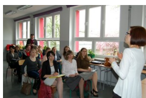
XVII Forum Języka Angielskiego #10