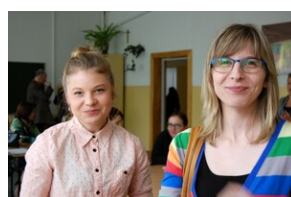
XVII Forum Języka Angielskiego #21