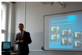
XVII Forum Języka Angielskiego #14