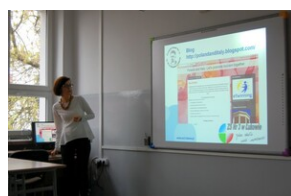
XVII Forum Języka Angielskiego #9