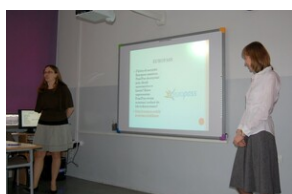
XVII Forum Języka Angielskiego #22