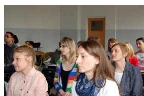
XVII Forum Języka Angielskiego #24