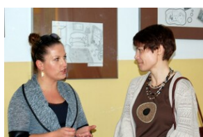
XVII Forum Języka Angielskiego #19