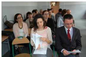
XVII Forum Języka Angielskiego #17