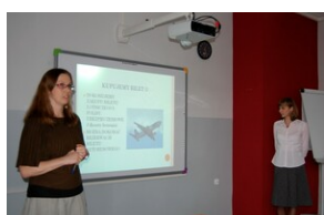
XVII Forum Języka Angielskiego #25