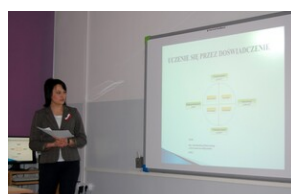
XVII Forum Języka Angielskiego #30