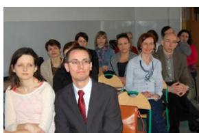
XVII Forum Języka Angielskiego #11