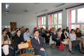
XVII Forum Języka Angielskiego #8