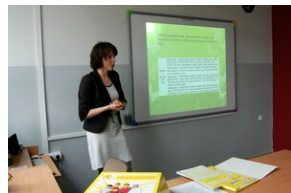
XVII Forum Języka Angielskiego #18