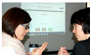
XVII Forum Języka Angielskiego #1

Ponad 30 nauczycieli z regionu lubelskiego wysłuchało prezentacji, w czasie których ich koledzy dzielili się swoimi doświadczeniami i osiągnięciami. Tutaj można się zapoznać z prezentacjami wygłoszonymi na Forum.