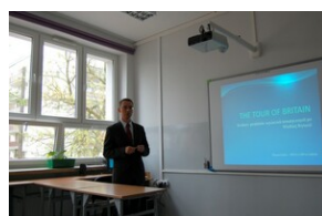
XVII Forum Języka Angielskiego #12