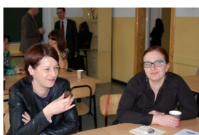
XVII Forum Języka Angielskiego #20