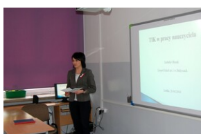
XVII Forum Języka Angielskiego #29