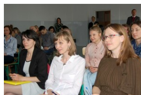
XVII Forum Języka Angielskiego #3