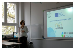
XVII Forum Języka Angielskiego #6