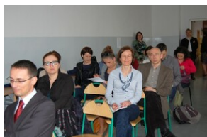
XVII Forum Języka Angielskiego #4