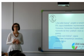
XVII Forum Języka Angielskiego #5