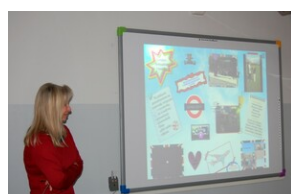
XVII Forum Języka Angielskiego #27