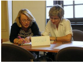
Egzaminy a metody.zip #8