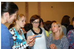
Egzaminy a metody.zip #35