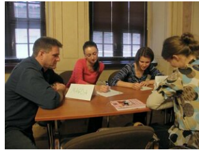
Egzaminy a metody.zip #9