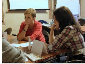
Egzaminy a metody.zip #12