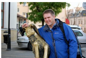
Egzaminy a metody.zip #38