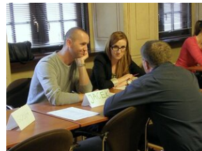
Egzaminy a metody.zip #16