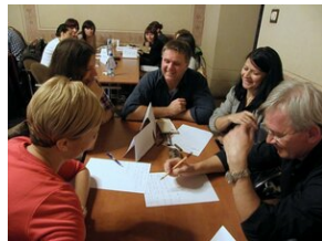
Egzaminy a metody.zip #15