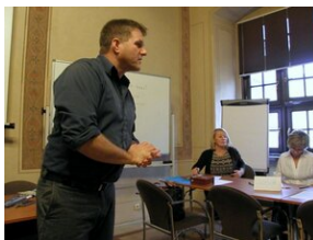
Egzaminy a metody.zip #5