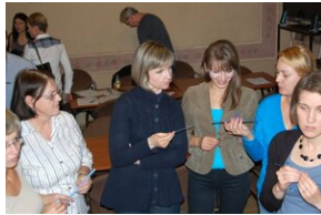
Egzaminy a metody.zip #27