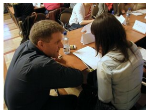
Egzaminy a metody.zip #18