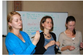
Egzaminy a metody.zip #28