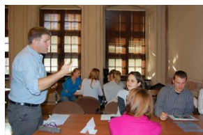
Egzaminy a metody.zip #24