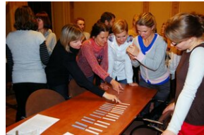
Egzaminy a metody.zip #31