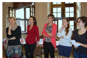
Egzaminy a metody.zip #37