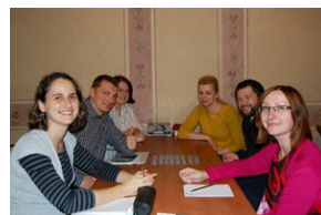
Egzaminy a metody.zip #25