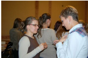
Egzaminy a metody.zip #29