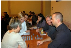
Egzaminy a metody.zip #26