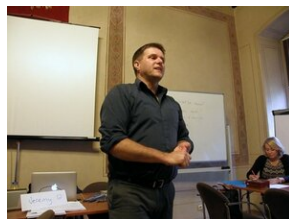
Egzaminy a metody.zip #6