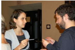
Egzaminy a metody.zip #30