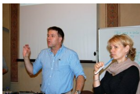
Egzaminy a metody.zip #36