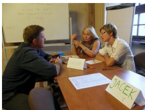
Egzaminy a metody.zip #17