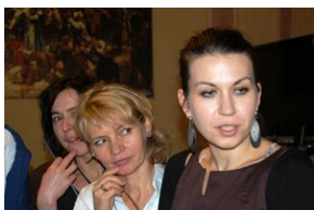
Egzaminy a metody.zip #23