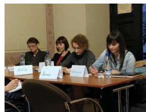
Egzaminy a metody.zip #3