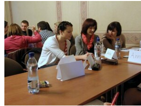
Egzaminy a metody.zip #10