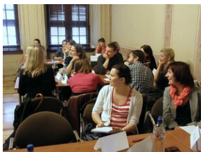
Egzaminy a metody.zip #20