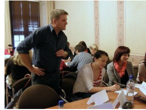
Egzaminy a metody.zip #13