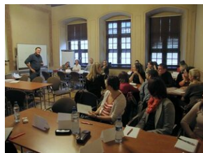
Egzaminy a metody.zip #21