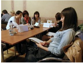
Egzaminy a metody.zip #11