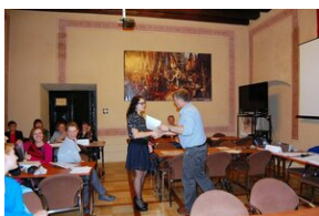
Egzaminy a metody.zip #32