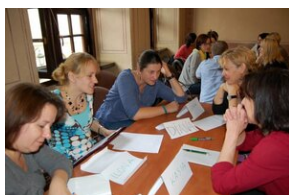
Egzaminy a metody.zip #33