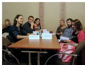
Egzaminy a metody.zip #2