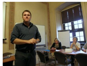
Egzaminy a metody.zip #7