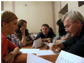
Egzaminy a metody.zip #14