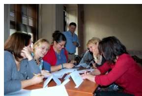
Egzaminy a metody.zip #34