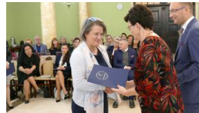
Wręczenie nauczycielom aktów powierzeń zadań doradcy metodycznego #15