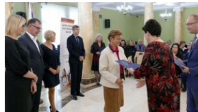
Wręczenie nauczycielom aktów powierzeń zadań doradcy metodycznego #14