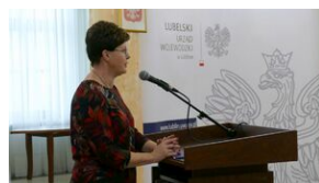
Wręczenie nauczycielom aktów powierzeń zadań doradcy metodycznego #3