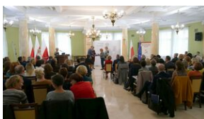
Wręczenie nauczycielom aktów powierzeń zadań doradcy metodycznego #22