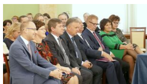
Wręczenie nauczycielom aktów powierzeń zadań doradcy metodycznego #1

Informację o uroczystości znajdziecie Państwo w dziale Wydarzenia .