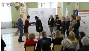
Wręczenie nauczycielom aktów powierzeń zadań doradcy metodycznego #16