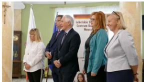
Wręczenie nauczycielom aktów powierzeń zadań doradcy metodycznego #13