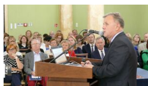
Wręczenie nauczycielom aktów powierzeń zadań doradcy