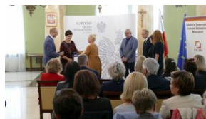
Wręczenie nauczycielom aktów powierzeń zadań doradcy metodycznego #17