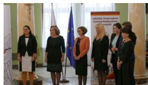
Wręczenie nauczycielom aktów powierzeń zadań doradcy metodycznego #20