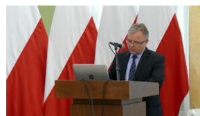
Wręczenie nauczycielom aktów powierzeń zadań doradcy metodycznego #24