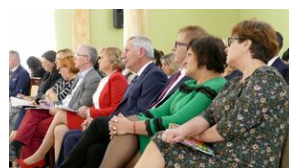
Wręczenie nauczycielom aktów powierzeń zadań doradcy