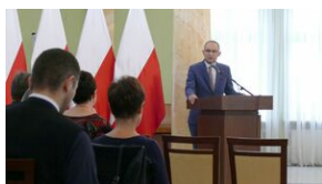
Wręczenie nauczycielom aktów powierzeń zadań doradcy metodycznego #8