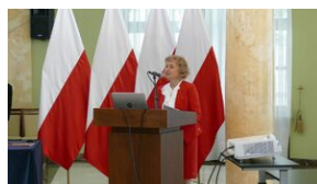
Wręczenie nauczycielom aktów powierzeń zadań doradcy metodycznego #23