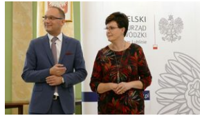
Wręczenie nauczycielom aktów powierzeń zadań doradcy metodycznego #11