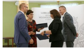
Wręczenie nauczycielom aktów powierzeń zadań doradcy metodycznego #12