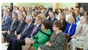
Wręczenie nauczycielom aktów powierzeń zadań doradcy metodycznego #5