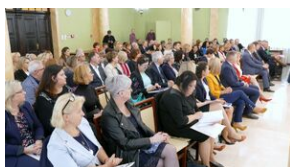
Wręczenie nauczycielom aktów powierzeń zadań doradcy metodycznego #2