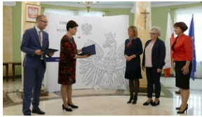
Wręczenie nauczycielom aktów powierzeń zadań doradcy metodycznego #10