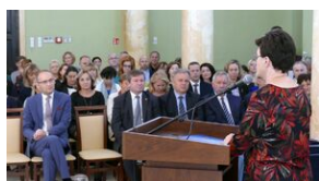
Wręczenie nauczycielom aktów powierzeń zadań doradcy metodycznego #4