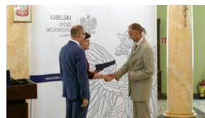
Wręczenie nauczycielom aktów powierzeń zadań doradcy metodycznego #18