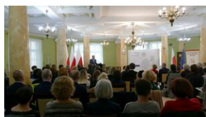
Wręczenie nauczycielom aktów powierzeń zadań doradcy metodycznego #7