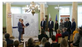
Wręczenie nauczycielom aktów powierzeń zadań doradcy metodycznego #21