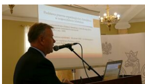
Wręczenie nauczycielom aktów powierzeń zadań doradcy