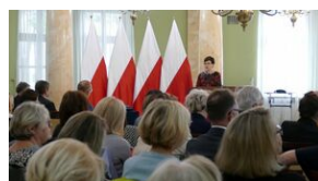
Wręczenie nauczycielom aktów powierzeń zadań doradcy metodycznego #6