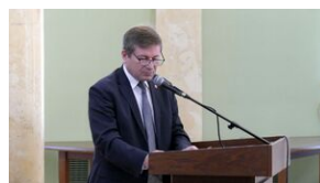
Wręczenie nauczycielom aktów powierzeń zadań doradcy metodycznego #9