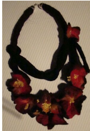
Zajęcia plenerowe #17