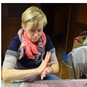
Zajęcia plenerowe #25