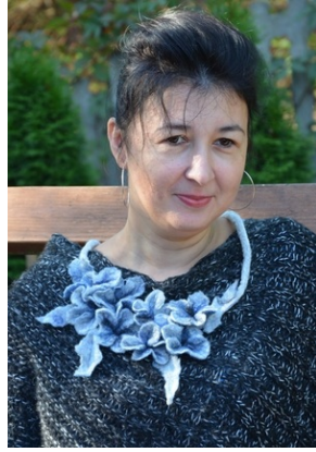
Zajęcia plenerowe #8