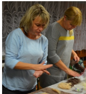
Zajęcia plenerowe #20