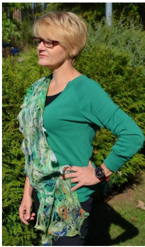
Zajęcia plenerowe #10