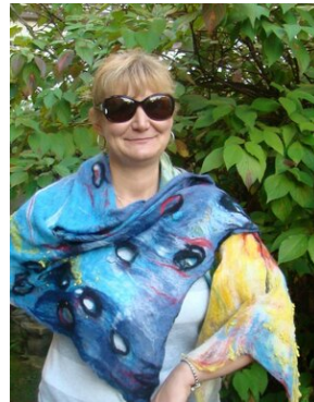
Zajęcia plenerowe #15