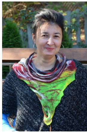
Zajęcia plenerowe #11