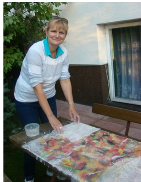
Zajęcia plenerowe #2