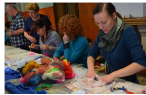
Zajęcia plenerowe #12