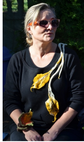
Zajęcia plenerowe #9