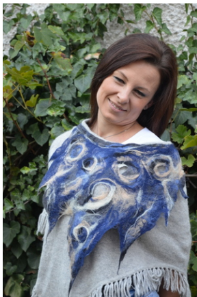
Zajęcia plenerowe #4