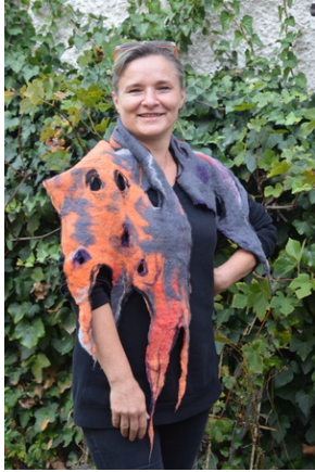
Zajęcia plenerowe #7