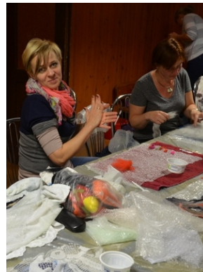
Zajęcia plenerowe #3