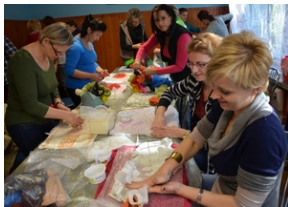
Zajęcia plenerowe #1