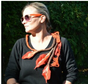
Zajęcia plenerowe #13