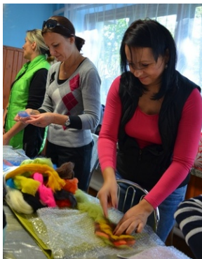
Zajęcia plenerowe #22