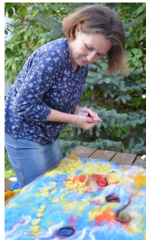
Zajęcia plenerowe #24