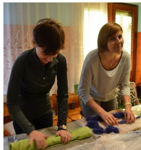
Zajęcia plenerowe #23