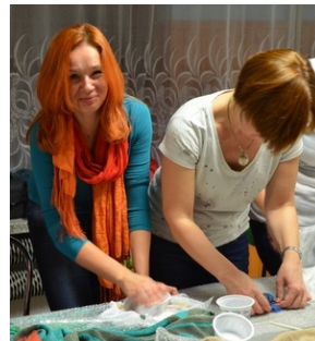
Zajęcia plenerowe #21