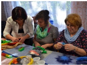
Zajęcia plenerowe #19