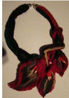
Zajęcia plenerowe #18