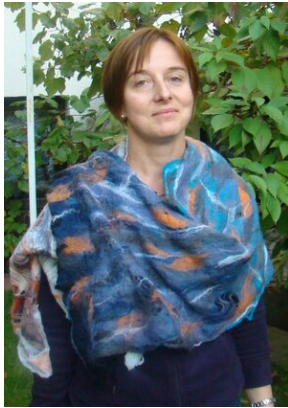
Zajęcia plenerowe #16