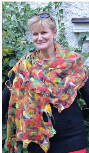
Zajęcia plenerowe #5