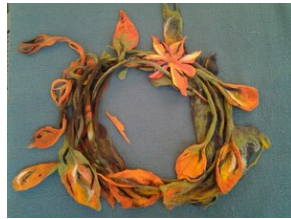
Zajęcia plenerowe #14