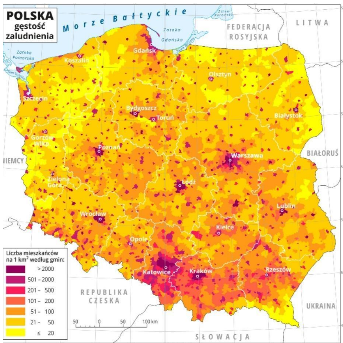
Mapa gęstości zaludnienia

Korzystając z powyższej mapy, oceń prawdziwość podanych zdań. Wybierz P, jeśli zdanie jest prawdziwe, albo F – jeśli jest fałszywe. Wybraną odpowiedź zaznacz kółkiem.