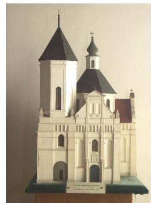
Model kościoła ormiańskiego w Zamościu (XVI wiek)