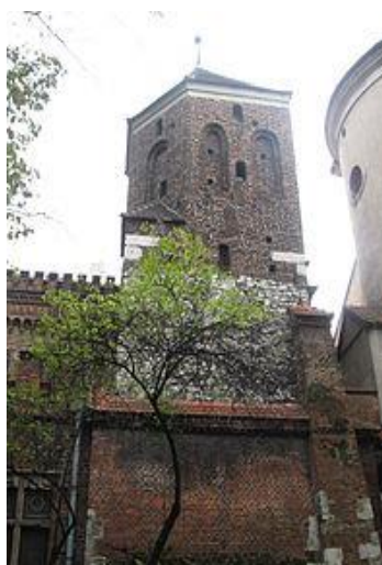
Baszta Cieśli w Krakowie