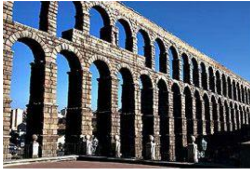
Akwedukt Aqua Appia w Rzymie