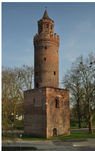
Baszta Tkaczy w Stargardzie

Na podstawie nazw baszt przedstaw sposób obrony średniowiecznych miast.