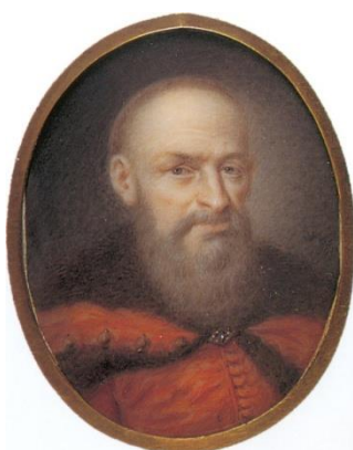
Franciszek Smuglewicz Bitwa (...)