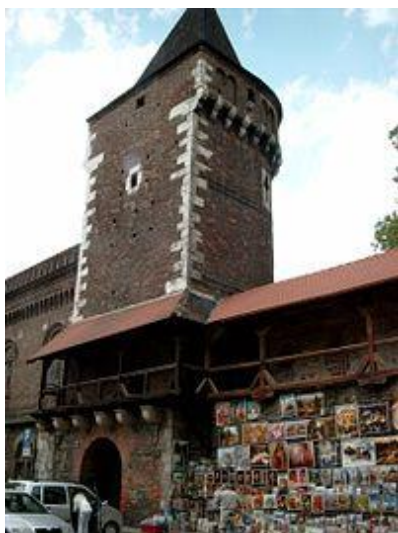
Baszta Stolarzy w Krakowie