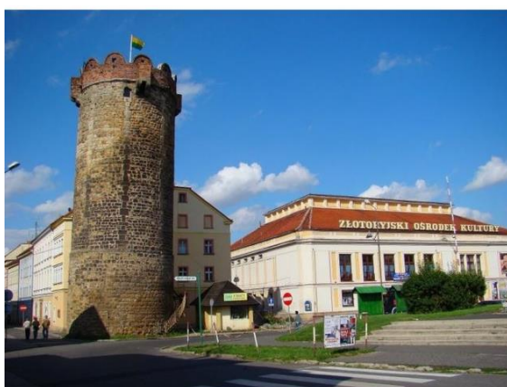
Baszta Kowali w Złotoryi