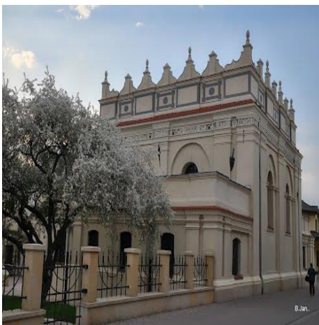
Synagoga w Zamościu (pocz. XVII wiek)

Stanisław Grzybowski, Jan Zamoyski , Warszawa 1994