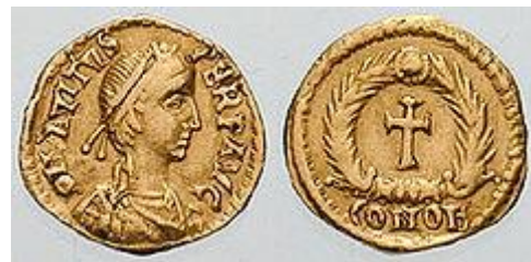
Cesarz Awitus. Czas panowania: 9 lipca 455 - 31 października 456 r. n.e.