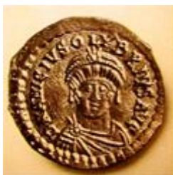
Cesarz Olibriusz Czas panowania: kwiecień – 2 listopada 472 r. n.e.