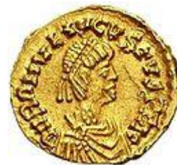
Cesarz Romulus Augustulus Czas panowania: 31 października 475 – 4 września 476 r. n. e.