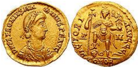
Cesarz Petroniusz Maksymus Czas panowania: 17 marca - 31 maja 455 r. n.e.

Korzystając z opisu monet rzymskich z wizerunkami cesarzy, podaj jedną przyczynę upadku Cesarstwa Zachodniorzymskiego w V wieku n.e.