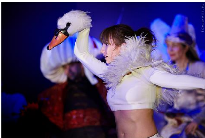
C) Łabędź z przedstawienia „Latający kufer”