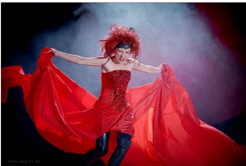
A) Czarownica z przedstawienia „Baśń o zaklętym kaczorze”