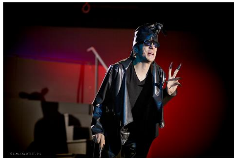
B) Kret z przedstawienia „Calineczka”