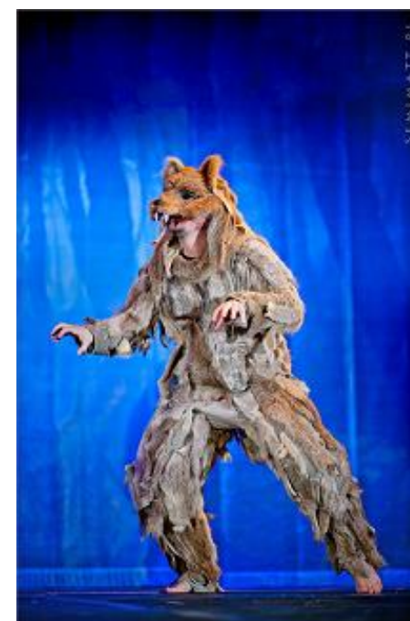
D) Wilk z przedstawienia „Wilk u bram”